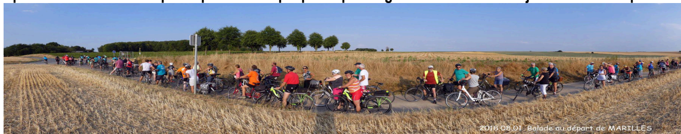
2018.08.01 Balade au départ de MARILLES

Balades ouvertes à tout public, y compris les enfants, elles sont gratuites et se déroulent sur ± 20 kms à allure modérée permettant à chaque cycliste, quel que soit son niveau, de découvrir les paysages et la nature des villages traversés. Chaque participant bénéficie d'une double assurance « accident corporel » & « défense en justice ». Il n'y a pas lieu de réserver sa participation. Chaque participant signe la feuille de route juste avant le départ.